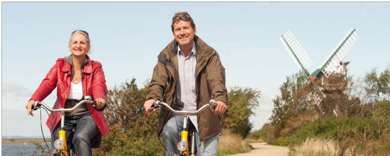
Radtour im Geltinger Noor

Die Tourismusverbände können sich freuen. 49 % jener, die im letzten Jahr keinen Radurlaub gemacht haben, planen für 2021 eine Reise. Radtouristen geben 70-100 Euro pro Tag aus. Der schnelle Ausbau des Radtourismus ist ein Konjunkturprogramm für die klassischen Tourismusregionen, für Städte und vor allem für die ländlichen Räume. Darüber hinaus lassen sich Synergieeffekte schaffen. Immer mehr Radtouristen nutzen ihr Rad nach einem Fahrradurlaub häufiger als zuvor. 59 % der Radler*innen nutzen auch Freizeitwege, fernab von verkehrsreichen Straßen. Von einer attraktiven Infrastruktur zum Radfahren profitieren somit nicht nur Radurlauber, sondern auch die Einheimischen auf Alltagswegen und in der Freizeit.