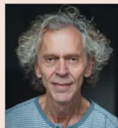
Sprecher Reiner Freund