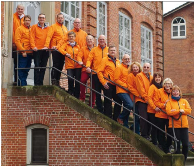
Team Pinneberg

Die Ortsgruppe Pinneberg des ADFC ist groß, politisch aktiv, fachlich kompetent und öffentlich präsent. Zehn Jahre nach der Gründung zählt die Gruppe ca. 400 Mitglieder*innen, von denen zwanzig politisch aktiv sind. Es gibt Spezialisten für Straßenverkehrsordnung, für Strassenbauvorschriften sowie neuerdings auch für Förderrichtlinien. Die Gruppe ist gut vernetzt mit der lokalen Verwaltung. Sitzungen werden regelmäßig besucht, Verkehrsschauen begleitet und jährlich mit der Bürgermeisterin eine Ortsterminradtour veranstaltet. Alle vier Wochen berichten die Mitglieder*innen über Aktivitäten, insbesondere über Radtouren, auf einer ganzen Seite in den Zeitungen der Region. Sie werden damit auch in den Nachbargemeinden wahrgenommen. Alles super also? Trotzdem belegt Pinneberg im aktuellen Fahrradklimatest den letzten Platz unter den gleichgroßen Städten. Die Gründe für dieses Missverhältnis haben wir mit den Pinnebergern diskutiert.