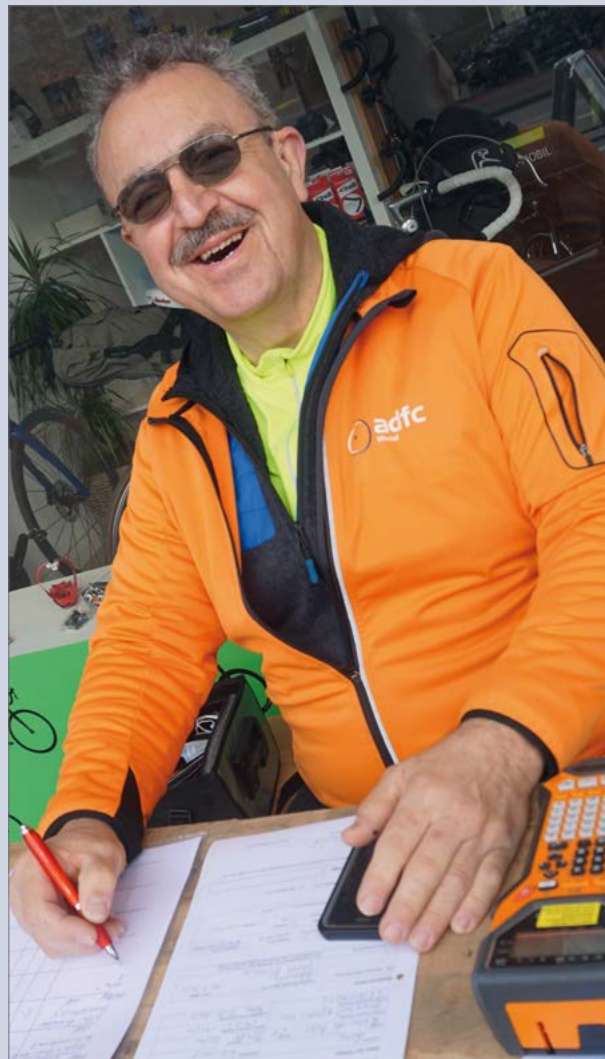
Beim Codieren