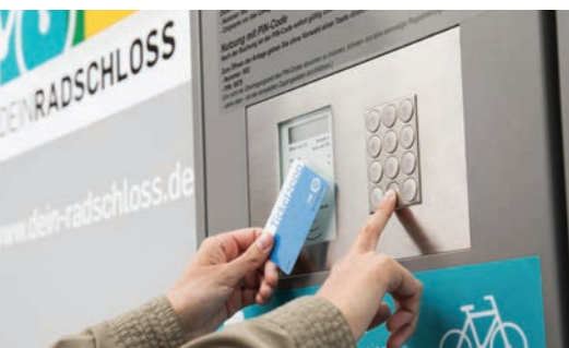
Modulare Bauweise Vielfältige Modellvarianten Modernes und zeitloses Design