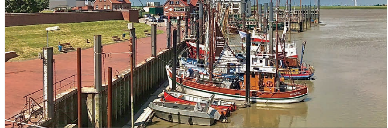
Ditzum an der Ems