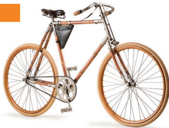
Bambusrad Grundner und Lemisch, Foto: Max Reder