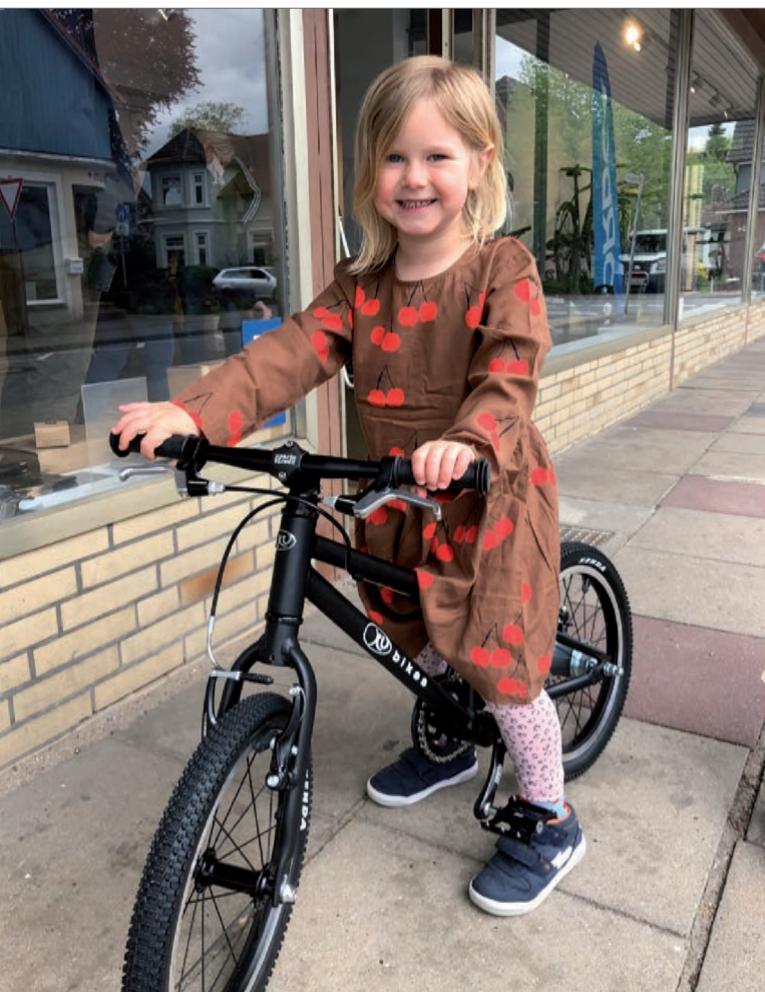
Da war das neue Rad noch ganz frisch