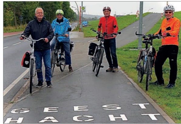
Aktive Geesthachter