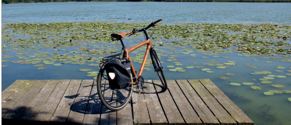
Seeblick mit Bambusrad