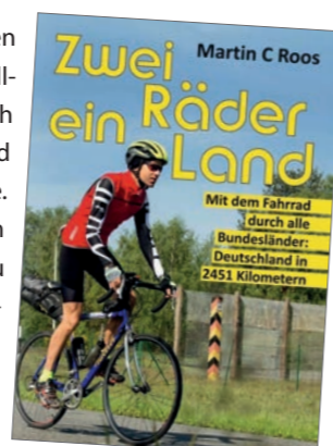
„Zwei Räder ein Land“ ISBN-13: 978-3749797578