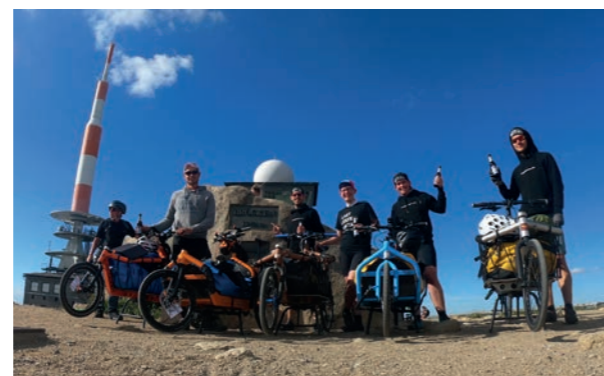
Auf dem Gipfel, Foto: S. Grothkopp

Das Interview führt PMS Redakteurin Ellen Pahlning