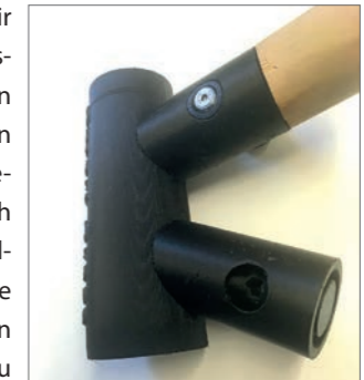
Muffe aus Lignin

Tatsächlich standen wir schon diverse Male mit Oswald und anderen Forschern im Austausch und finden verschiedene Ansätze interessant. Selbstverständlich können wir uns vorstellen, zukünftig auch andere Techniken zur Produktion unserer Bambusrahmen zu nutzen. Für uns essentiell ist aber die Umsetzung dieser Techniken vor Ort bei unserem Partner in Ghana.